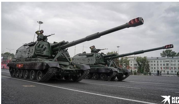
Самоходная гаубица "Мста-С" на параде в Самаре.