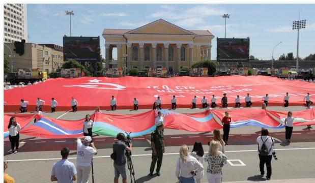
В Ставрополе развернули самое большое в стране Знамя Победы, общей площадью в 15 тысяч м2.

В Ставрополе в парадном строю прошли более 1700 человек. Впервые в парад включили расчет из 50 военнослужащих-женщин. Кстати, в ЮВО посчитали - каждый участник парада за время репетиций прошел строевым шагом около 50 км. Кроме военных и механизированной техники в Параде Победы в Ставрополе впервые задействовали квадроциклы спецназа и лошадей горных вьючных пород из КЧР. Также по площади Ленина проехали два необычных парадных кабриолета.