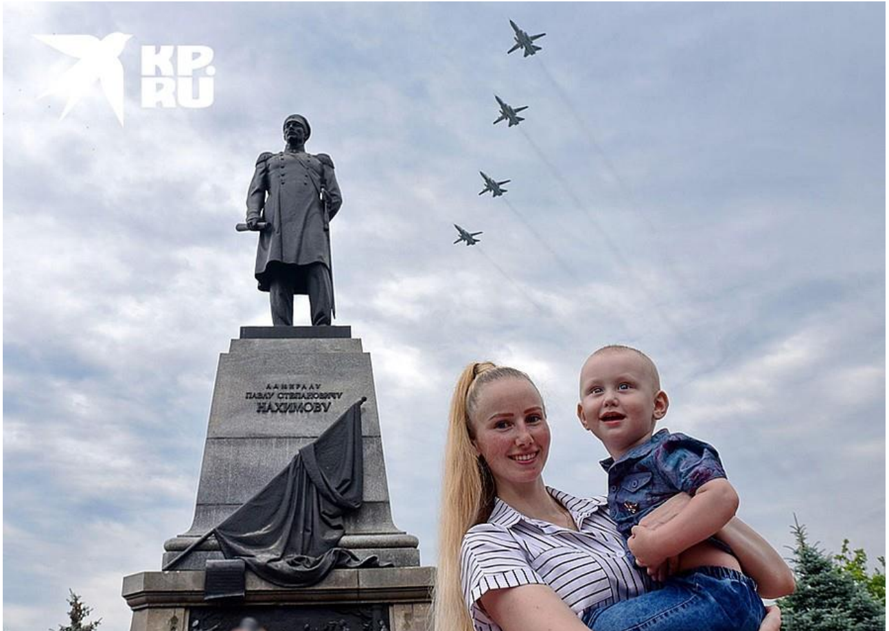
Воздушный парад в Севастополе Фото: Юрий ЮГАНСОН

Источник: КОМСОМОЛЬСКАЯ ПРАВДА Ссылка: https://www.kp.ru/daily/27146/424157/