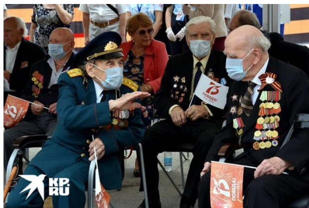
Ветераны на Параде Победы в Симферополе.

Крымчанам повезло. Парад Победы в Симферополе они наблюдали воочию, а не дома по телевизору. Всем зрителям, кто пришел на проспект Кирова, выдавали маски, мерили температуру и пропускали на свободные места. Соблюдать дистанцию нужно было в 1,5 метра, но когда началось шествие, люди старались пробираться как можно ближе к технике и забыли про меры безопасности.