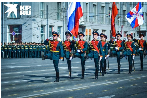
Обязательный ритуал - вынос знамен - сопровождался песней «Священная война».

В Новосибирске, как и во многих других городах России, парад Победы проходил без зрителей, но горожане наблюдали за ним онлайн. Праздник начался с традиционного шествия военнослужащих, затем сибиряки увидели парад военной техники и авиашоу. Всего в параде участвовали более 2,2 тысяч человек, в том числе две женские роты, а также свыше 60 единиц техники.