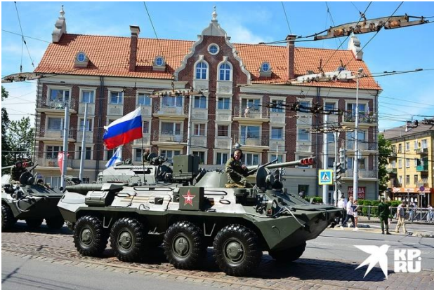
В Калининграде в военном параде приняли участие 75 единиц техники.

В Калининграде в военном параде приняли участие 75 единиц техники. Горожане увидели танки Т-72Б3, крупнокалиберные пушки «Гиацинт», самоходные артиллерийские установки «Гвоздика». В воздушной части парада было задействовано 20 самолетов и вертолетов морской авиации Балтийского флота. В небе над площадью Победы пролетели истребители Су-27 и Су-30СМ, фронтовые бомбардировщики и другая военная техника.