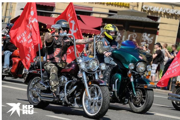
В шествии приняли участие даже байкеры города.

Сразу после парада по Невскому проспекту прошли пешие парадные расчеты, а за ними - колонна мотоциклистов. Парад проходил при строгом соблюдении правил безопасности. На входе всем измеряли температуру, проверяли наличие масок и антисептиков.