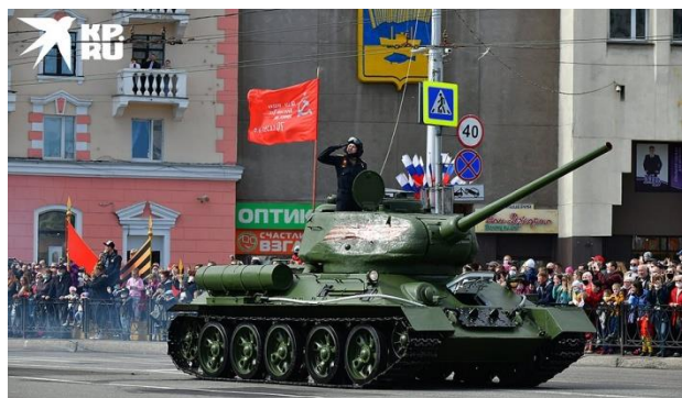
Танк Т-34 на Параде Победы в Мурманске.

В Ростове из-за пандемии коронавируса зрителей на параде было не много. Присутствовать на торжественном шествии смогли только ветераны Великой Отечественной войны, а также их сопровождающие. На парад допустили еще и журналистов, но только тех, кто прошел тест на коронавирус. Тем не менее, шествие было потрясающим. Горожане наблюдали за всем онлайн.