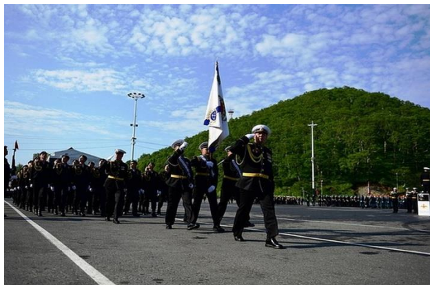
Парад в честь 75-летия Победы на Камчатке.

Самый первый российский Парады Победы прошел на Камчатке. Из-за разницы во времени именно с этого региона начался марафон праздничных шествий. В этом году в параде на Камчатке приняли участие больше 900 военных. Местные жители наблюдали за грандиозным шествием онлайн.