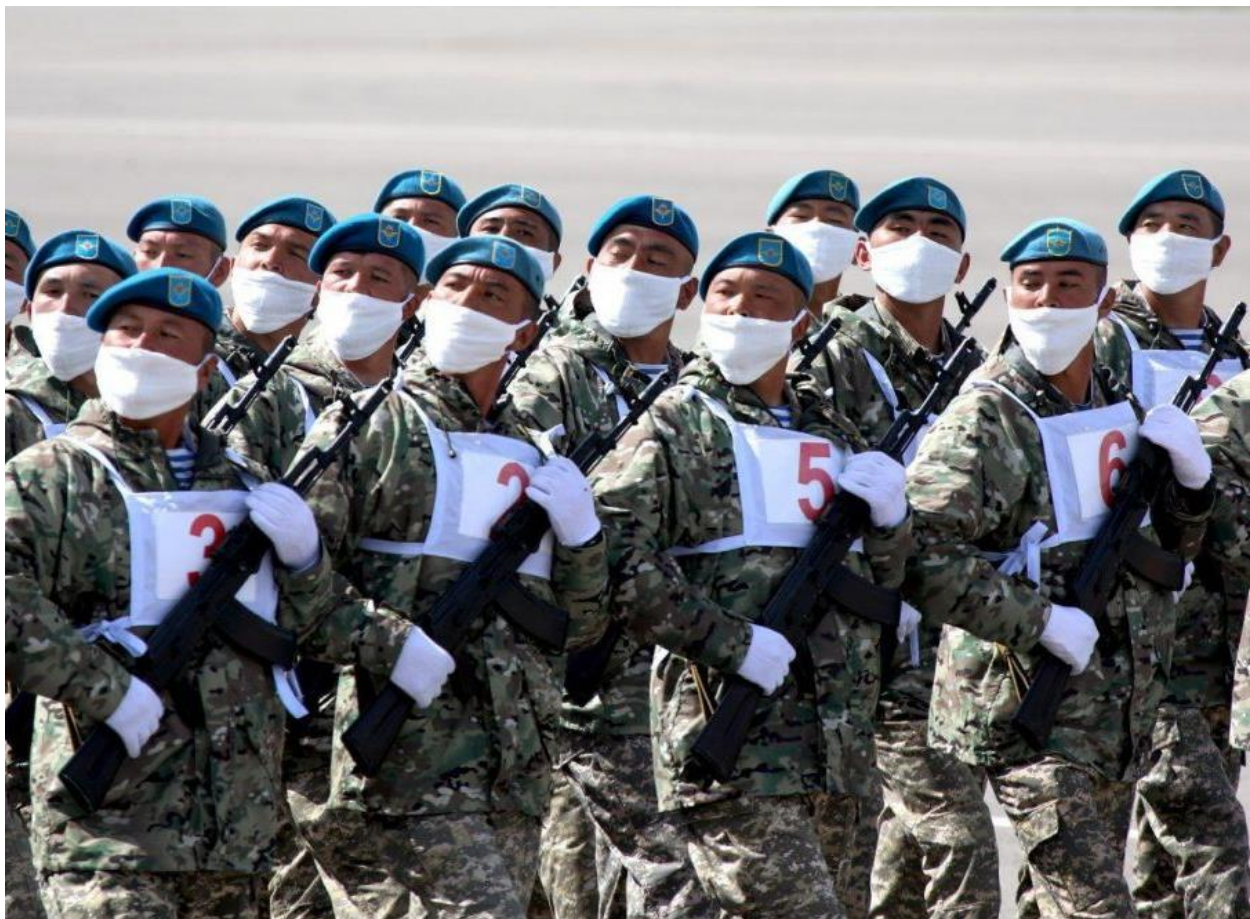
Казахстанские военнослужащие готовятся к участию в военном параде в Москве

Ссылка на материал: https://tass.ru/obschestvo/8765705/