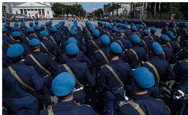
Участники парада в Воронеже.

В Воронеже в торжественном шествии приняли участие больше 100 единиц военной техники. В числе 3 тысяч военнослужащих, прошагавших по центральной площади, впервые были женщины-гвардейцы. Кстати, к параду в городе подготовились основательно. Ночью нанесли на тротуары специальную разметку, чтобы гости знали, где нужно стоять, чтобы не нарушать дистанцию.