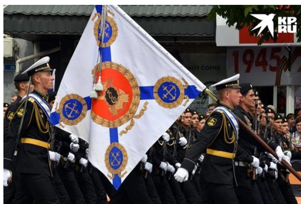
Моряки Черноморского флота во время парада.

В Севастополе праздник начался с яркого морского парада. В 9.00 в Севастопольской бухте выстроился парадный строй кораблей Черноморского флота, на которых одновременно подняли Андреевский флаг. После возложения цветов к Вечному огню в городе-герое прошли наземный и воздушный Парады Победы.