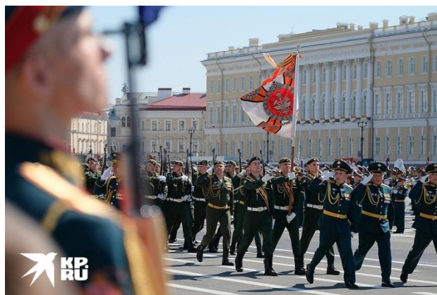
Парад прошел на Дворцовой площади Северной столицы.

В Санкт-Петербурге праздничное шествие было захватывающим. По Дворцовой площади прошли 4,5 тысячи военных в парадных мундирах и колонны бронетехники, а в воздух поднялись 34 самолета и вертолета.