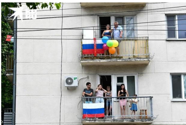
Некоторым жителям города посчастливилось наблюдать за военным торжеством со своих балконов.

В Ростове из-за пандемии коронавируса зрителей на параде было не много. Присутствовать на торжественном шествии смогли только ветераны Великой Отечественной войны, а также их сопровождающие. На парад допустили еще и журналистов, но только тех, кто прошел тест на коронавирус. Тем не менее, шествие было потрясающим. Горожане наблюдали за всем онлайн.