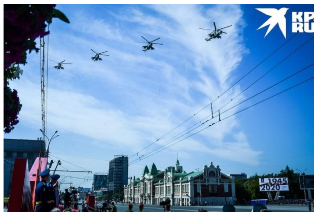
Самыми первыми пустили Ми-8.

Крымчанам повезло. Парад Победы в Симферополе они наблюдали воочию, а не дома по телевизору. Всем зрителям, кто пришел на проспект Кирова, выдавали маски, мерили температуру и пропускали на свободные места. Соблюдать дистанцию нужно было в 1,5 метра, но когда началось шествие, люди старались пробираться как можно ближе к технике и забыли про меры безопасности.