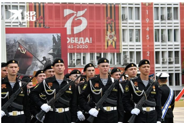
Участники Парада Победы в Новороссийске.

В Новороссийске помимо парада Победы, в котором участвовали 1,5 тысячи военных, прошел любимый горожанами морской парад. В акваторию Цемесской бухты вышли десятки кораблей, а в небо поднялись истребители, штурмовики и вертолеты