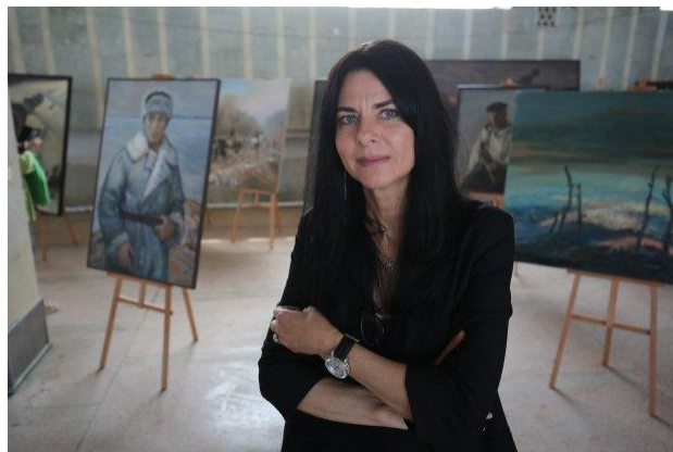
Тишина после боя

Художественную коллекцию, собранную в течение трех лет, Волгоград получил в дар как знак уважения к подвигу его защитников.