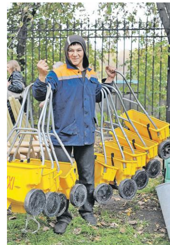
Столица открыта для трудовых мигрантов, не нарушающих российские законы.

Мэр: - Я ничего не знаю про новые мечети. Мы никаких разрешений на строительство не выдаем. Сейчас достраивается соборная мечеть возле «Олимпийского», других объектов в городе не знаю. Считаю, что в Москве достаточно мечетей. Тем более мы видим, на религиозные мусульманские праздники в основном приезжают верующие из других регионов, из Московской области. От 60 до 70 процентов - приезжие. Но мы не можем обеспечивать всех желающих. Мне кажется, это не нужно.