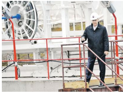
Сергей Собянин: со строительных лесов перспектива часто виднее.