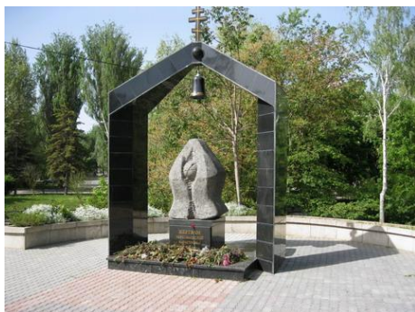
Памятник жертвам Чернобыльской катастрофы (г.Симферополь)

26 апреля 1986 года произошла одна из крупнейших аварий на атомных электростанциях — авария на Чернобыльской АЭС (ЧАЭС).