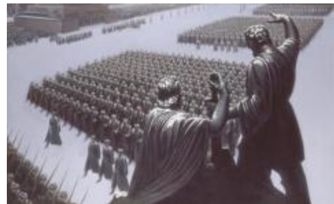
Парад 1941 года в Москве

День воинской славы России, отмечаемый сегодня, установлен Федеральным законом № 32-ФЗ от 13 марта 1995 года «О днях воинской славы и памятных датах России».