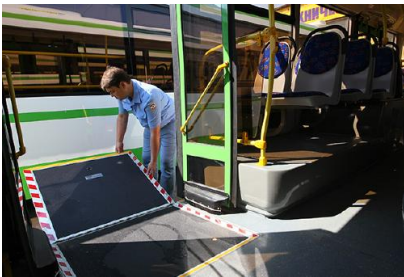
Автобус, оборудованный пандусом для инвалидов.

Есть специальная программа социальной интеграции инвалидов. В соответствии с этой программой мы обновили две трети наземного пассажирского транспорта, совершили просто революцию. Сегодня две трети транспорта «Мосгортранса» — это низкопольные автобусы. Следующим шагом мы заставим все частные компании закупать современный низкопольный транспорт. Второе. Около 76 процентов всех общественных объектов города уже оборудованы пандусами или приспособлениями для того, чтобы можно было заезжать туда на коляске. То же самое мы непреклонно требуем от всего нового строительства — торговли, бизнес-центров, чего угодно.