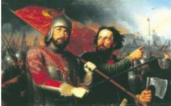
Минин и Пожарский. Художник М. И. Скотти, 1850 год

4 ноября — день Казанской иконы Божией Матери — с 2005 года отмечается как День народного единства. Этот праздник установлен в честь важного события в истории России - освобождения Москвы от польских интервентов в 1612 году.