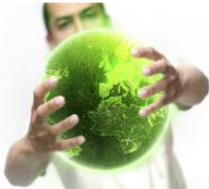
Вечный вопрос — каков он, настоящий мужчина?

Господа мужчины! Если женское население считает, что ближайший всплеск повышенного внимания к сильной половине человечества стоит проявлять не ранее, чем 23 февраля, то вы имеете полное право напомнить, что есть и другая достойная дата.