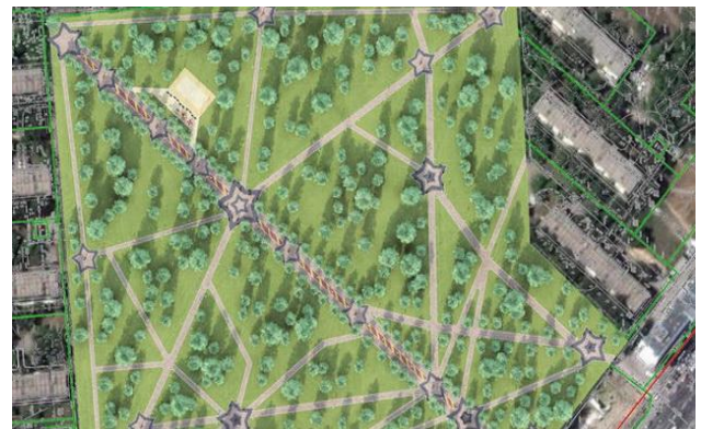
С высоты новый сквер будет напоминать небесное созвездие.

Но, что самое главное – сквер, как минимум, станет удобнее и симпатичнее. Дорожки замостят, цветов посадят больше, да к тому же построят фонтан – у самого входа в сквер. Благоустройство сквера Сибиряков-Гвардейцев начнется уже в 2014 году. Однако, окончательный вид он примет лишь к 70-летию юбилею Победы в 2015 году.