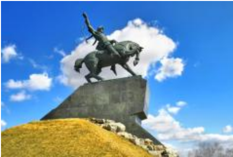
Памятник Салавату Юлаеву в Уфе

11 октября Башкортостан празднует День Республики — День принятия Декларации о государственном суверенитете Башкирской Советской Социалистической Республики. В этот день в 1990 году Верховным Советом республики была провозглашена Декларация о государственном суверенитете.