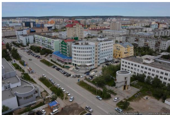
«Молодеет наш Якутск»

Подробная информация о конференции на сайте МАГ www.e-gorod.ru