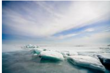
Ледяной Байкал

«Славное море — священный Байкал...» — это неповторимо прекрасное сибирское озеро не может оставить равнодушным ни поэтов, ни ученых, ни просто туристов из многих стран. Бай-Куль — Байкал — в переводе с тюркского «богатое озеро». День Байкала учрежден в 1999 году и с тех пор ежегодно отмечался в четвертое воскресенье августа.