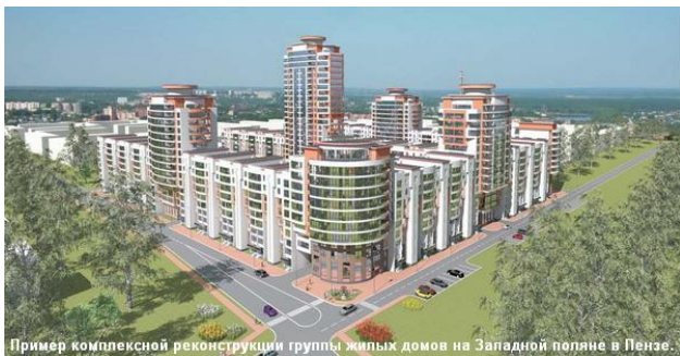
Пример комплексной реконструкции группы жилых домов на Западной поляне в Пензе.