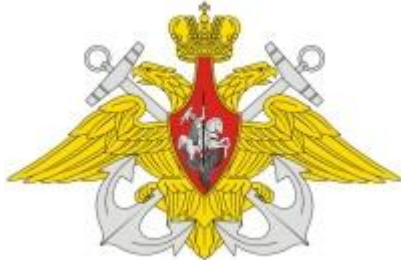
Эмблема ВМФ России

День Военно-морского флота отмечается в России в последнее воскресенье июля на основании Указа Президиума Верховного Совета СССР от 1 октября 1980 года «О праздничных и памятных днях». Это один из самых любимых еще в СССР, а затем России праздников, имеющий неофициальное название День Нептуна.