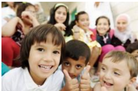
Один из самых молодых праздников в календаре

В мире нет ничего лучше и приятнее дружбы; исключить из жизни дружбу — все равно, что лишиться мир солнечного света. Цицерон Международный день дружбы (International Day of Friendship) — один из самых молодых праздников в календаре. Решение о его проведении Генеральная ассамблея ООН приняла 27 апреля 2011 года на своей 65-й сессии. Идеологической основой для новой даты стали Декларация и программа действий в области культуры мира и Международного десятилетия культуры мира и ненасилия в интересах всей планеты (оно охватывало 2001–2010 годы).