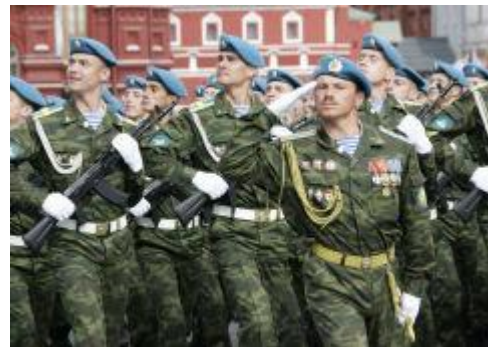
Десантники на параде в Москве (9 мая 2005 года)

Воздушно-десантные войска — «крылатая пехота», «голубые береты» — какими только эпитетами не награждали гвардейцев-десантников, но всегда, во все времена и при любых обстоятельствах неизменно оставались сила, мужество и надежность людей, живущих по принципу: «Никто, кроме нас!».