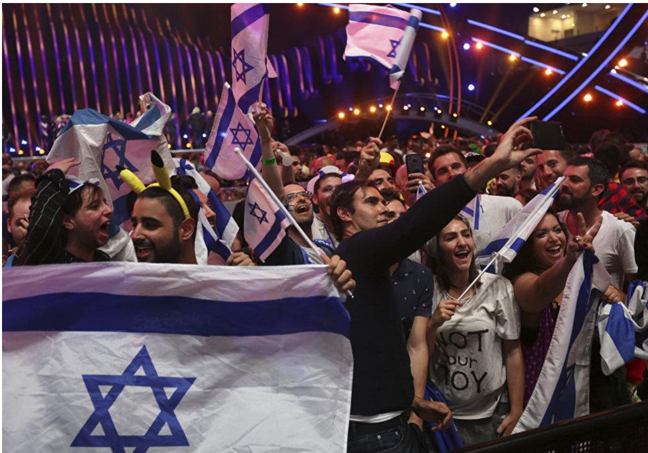
Израильские болельщики празднуют победу Нетты Барзилай в финале конкурса Евровидение. 12 мая 2018. Архивное фото

Евровидение в 2019 году впервые пройдет в Тель-Авиве. Израиль уже принимал у себя международный конкурс в 1979 и 1999 годах — тогда соревнование исполнителей песен проходило в Иерусалиме. Но на этот раз организаторы отказались от этой площадки в пользу Тель-Авива. О преимуществах города, перспективах его развития, а также об интересе к сотрудничеству с Москвой мэр Рон Хульдаи рассказал в интервью РИА Новости.