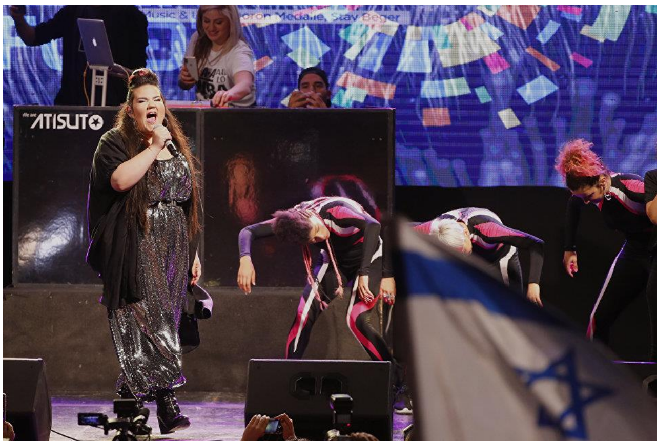
Нетта Барзилай во время концерта в Тель-Авиве после победы в финале международного конкурса "Евровидение-2018".

https://ria.ru/interview/20181020/1531040069.html