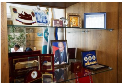
Памятный стенд в кабинете мэра Калининграда

Эту схему мы опробовали вовремя Чемпионата мира по футболу. Но собственные объемы техники мы будем наращивать, чтобы город был чистым и нам с вами в нем было комфортно. Но в то же время к зиме мы будем заключать соглашения с организациями, которые сегодня имеют необходимую технику для уборки снега.