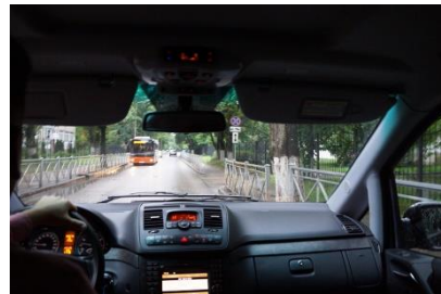
Улица Зеленая. место подтопления дороги. Вода уже сошла