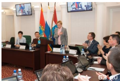
«Клянусь работать на благо Самары»: слова из присяги

— Я осознаю весь груз ответственности, который я готова на себя взять, если вы меня поддержите. Могу выносить вопросы на федеральный уровень. Приносить лучшие практики по развитию города из других регионов.