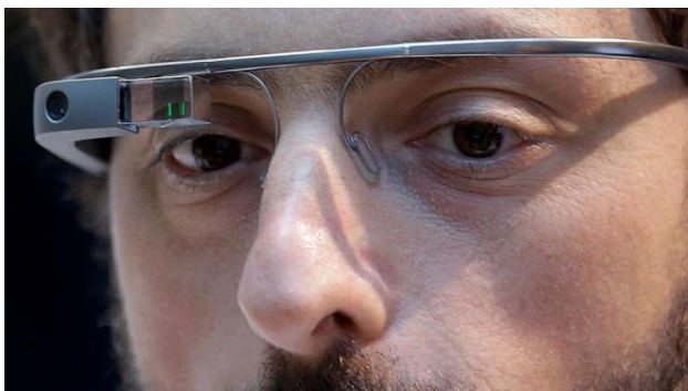
Очки Google Glass.

Поэтому немалая часть действенных когда-то способов спрятаться от камер сейчас уже не работает. В первую очередь речь идет о светодиодах, засвечивающих изображение. Шесть лет назад вышла ограниченная серия очков Google Glass, которые, среди прочего, умели распознавать лица (по крайней мере так заявляли в Google). В ответ на это ученые из Токийского национального института информатики и технологического университета Токио создали очки со встроенными инфракрасными светодиодами. Они превращали лицо в расплывчатое пятно света для камеры, работающей в инфракрасном диапазоне. Такого же эффекта можно достичь, если светить лазерной указкой прямо в объектив.