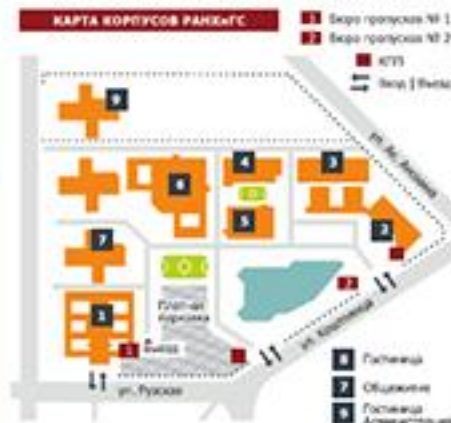
КАРТА КОРПУСОВ РАНХиГС

Адрес: г. Москва, пр-т Вернадского, д. 84, корп. 6, каб. 3006 www.migsu.ranepa.ru