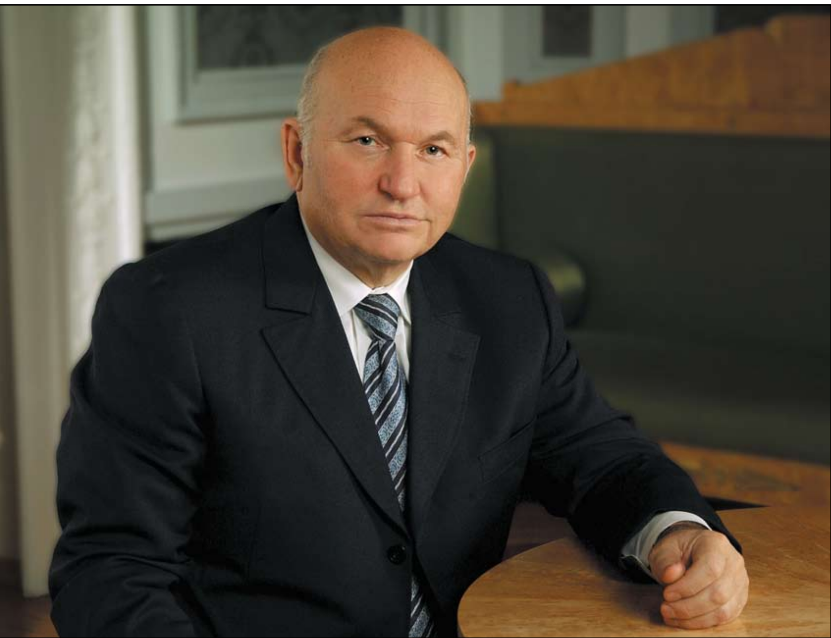
Лужков Юрий Михайлович, руководитель МРГ, Президент МАГ, Мэр Москвы